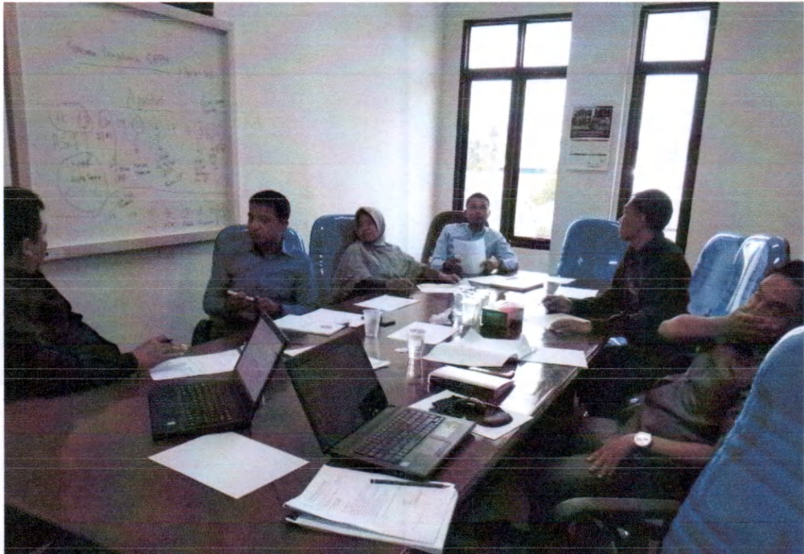
Rapat Perubahan Perencanaan tanggal 13 Agustus 2018